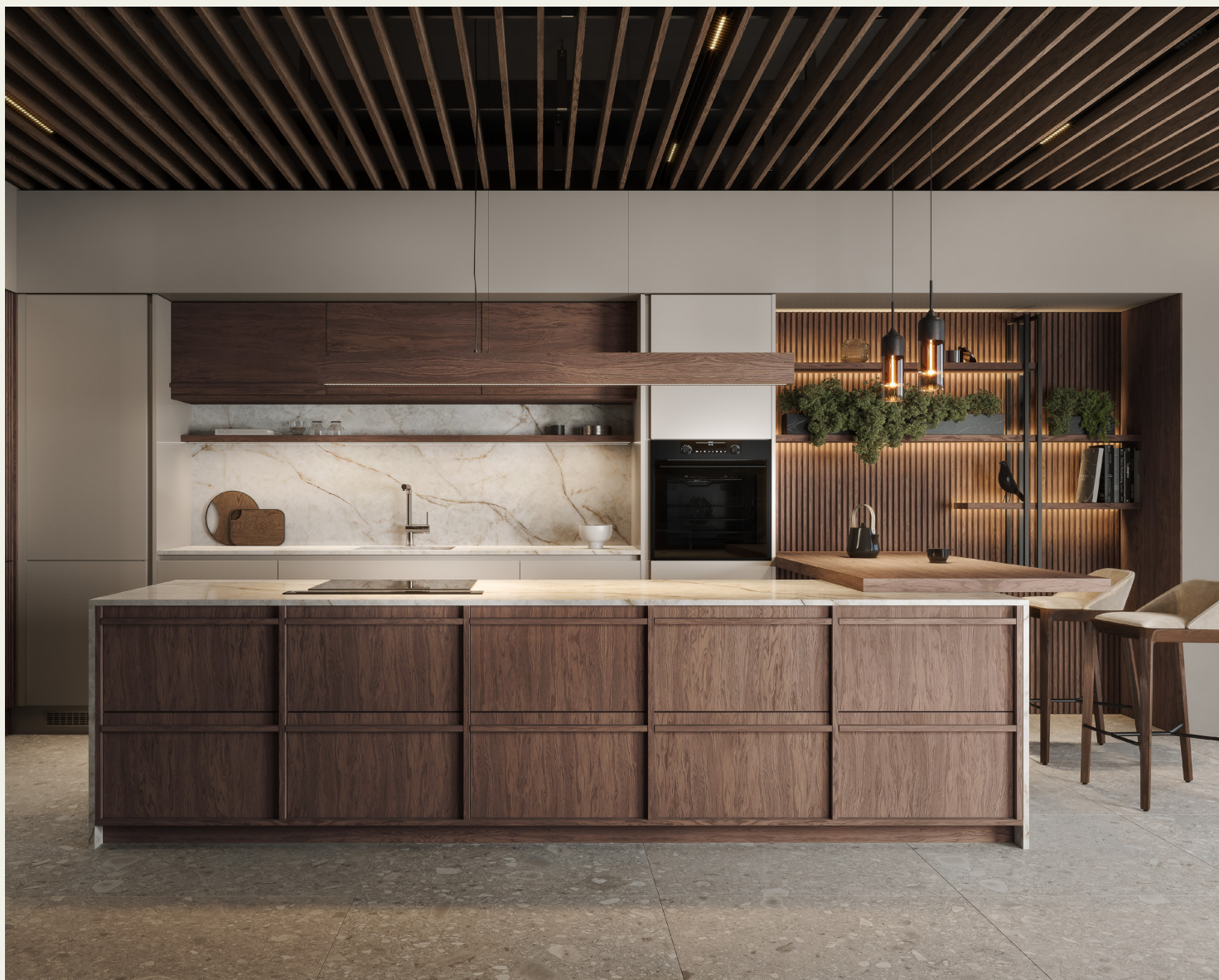
Фьюджи: отделка Джорджия Фасады МДФ: отделка Смок

Особенностью дизайна является планировочный подход, заключающийся в наличии акцентированных ребер, ручек из цельного дерева и решетчатых витрин. В результате формируется современная минималистичная композиция, обладающая неповторимыми японскими чертами, легкими и воздушными, которые гармонично интегрируются в любой дом или квартиру, независимо от местоположения.