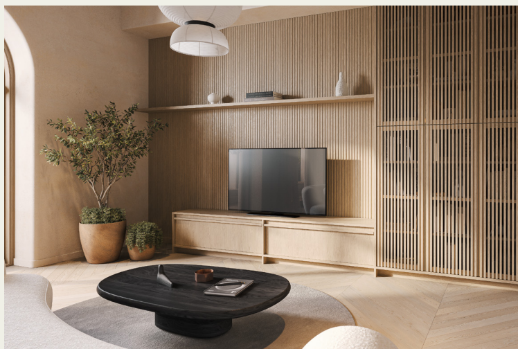
Фьюджи: отделка Карамеру

Мебель в гостиной выполнена в идентичной цветовой гамме. Гармонично смотрятся низкие лаконичные тумбы под телевизор — отличное решение для интерьера в стиле Сканди или Джапанди.