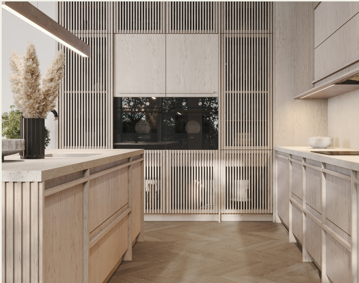
Фьюджи: отделка Хюгге

Витрины Фьюджи, напоминающие бамбуковые ширмы, являются сдержанным акцентом кухни. Расстояние между планками и их толщина имеют идеальные пропорции, незаметные на первый взгляд, но максимально согласующиеся с перегородками и ручками на фасадах.