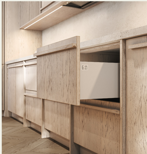
Фьюджи: отделка Хюгге

Необычная ручка-профиль на глухих фасадах изготовлена на фабрике из натурального массива, что дает возможность выкрашивать ее в цвет фасада с учетом мельчайших оттенков.