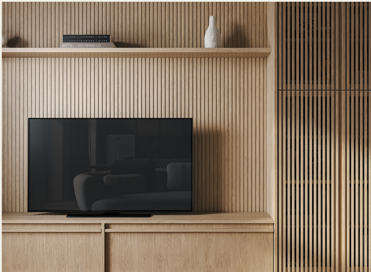
Фьюджи: отделка Карамеру

Дополнить рисунок мебели и подчеркнуть динамику реечных стеллажей можно благодаря использованию декоративных стеновых панелей из натурального шпона.