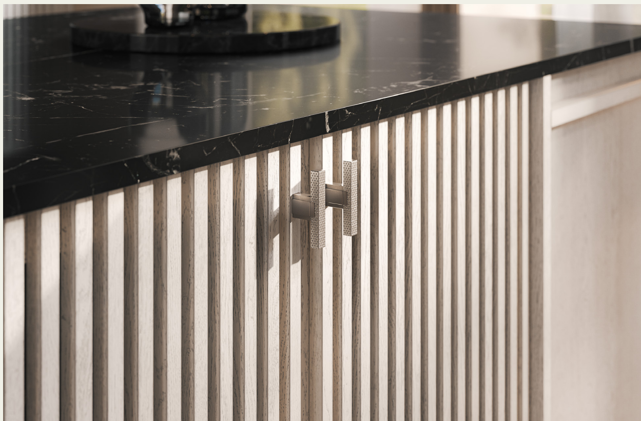
Фьюджи: отделка Сиена

Есть ещё и третий вариант: идеальная по форме и отделкам итальянская ручка, ширина которой максимально подобрана к толщине реек.