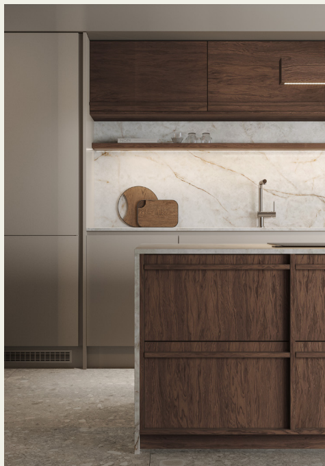
Фьюджи: отделка Джорджия Фасады МДФ: отделка Смок

Использование натурального массива в прозрачных дизайнерских отделках и простых деревянных ручках создает невесомое органичное пространство в стиле Джапанди, Ваби Сабидо либо Сканди, которое мягко вписывается в лаконичный современный интерьер.