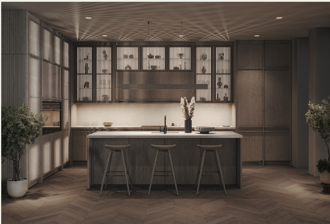
Фьюджи: отделка Хюгге