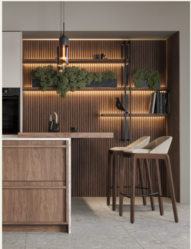
Фьюджи: отделка Джорджия