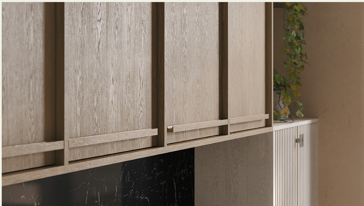
Фьюджи: отделка Карамеру

Деревянная ручка является концептуальным элементом кухни, и в сочетании с промежуточными панелями создает уникальное архитектурное решение модели, которое отличает Фьюджи от любой другой кухни на рынке.