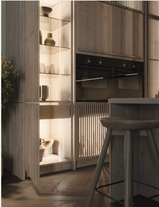
Фьюджи: отделка Хюгге

Встроенная подсветка позволяет придать дополнительную игру света и тени на кухне в вечернее время.