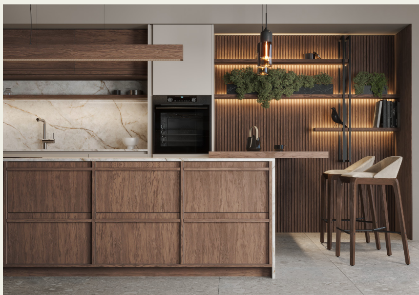
Фьюджи: отделка Джорджия Фасады МДФ: отделка Смок