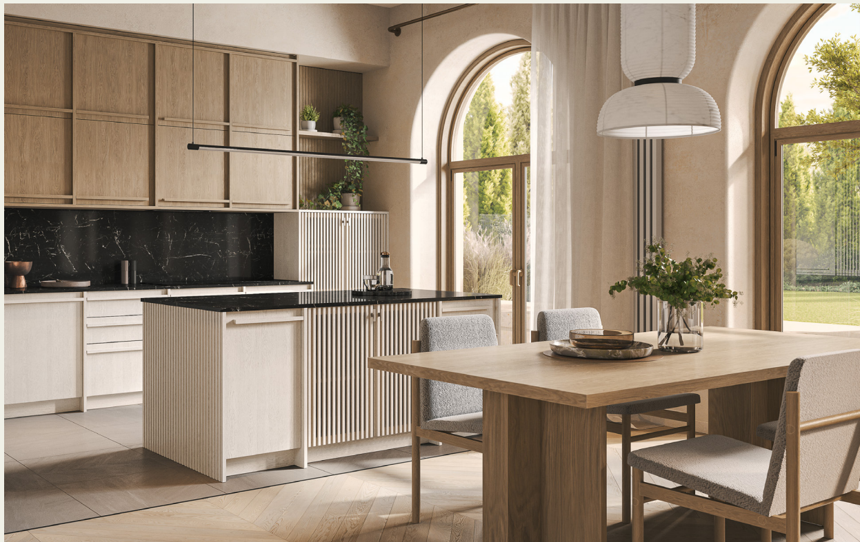
Фьюджи: отделка Карамеру, Сиена

Модель Фьюджи позволяет делать гармоничные переходы из кухонного пространства в зону столовой и гостиной.